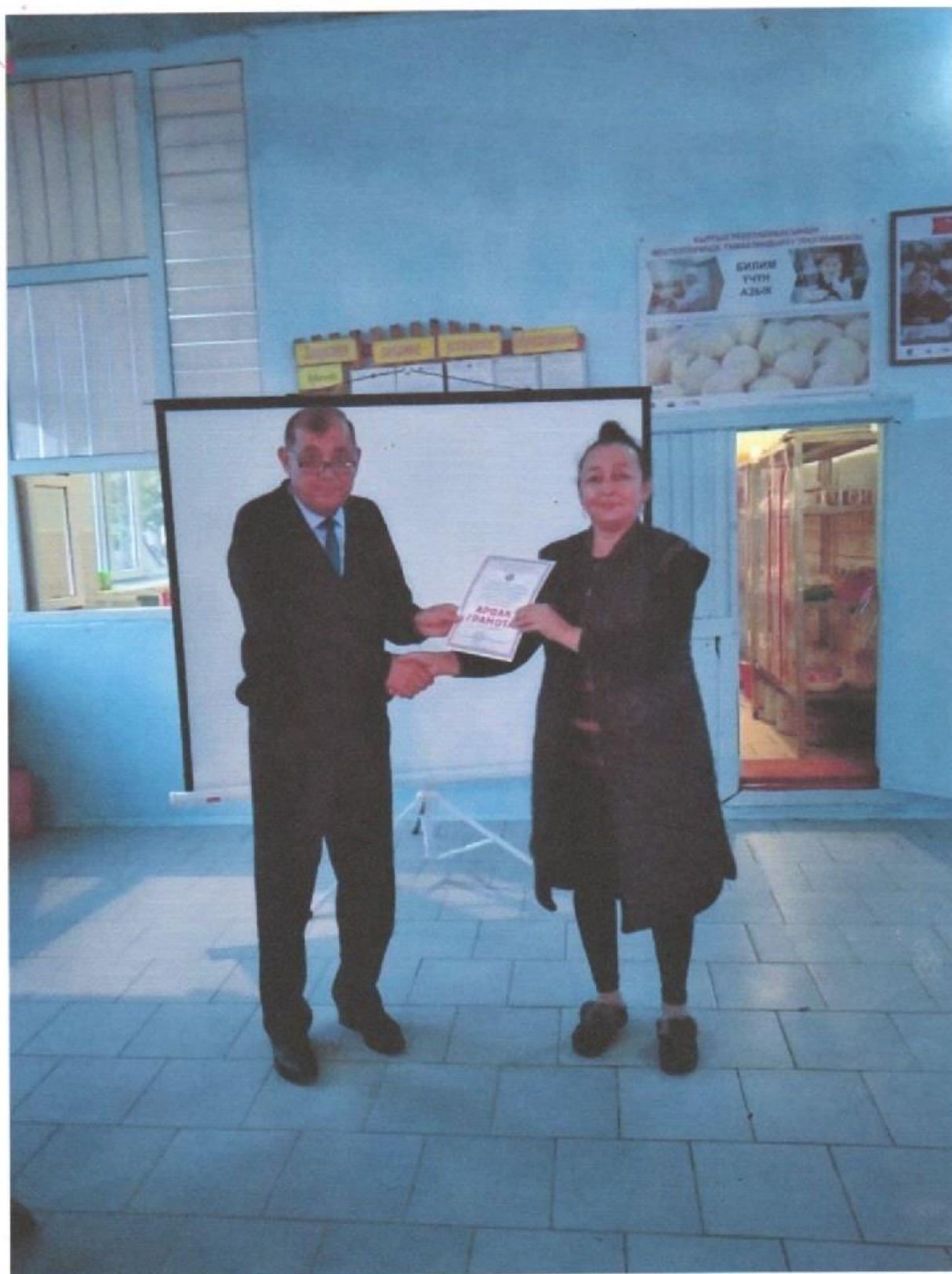
Айыл өкмөт тарабынан берилген акча кесиптик майрамда мугалимдерге сыйлык катары таратылды.